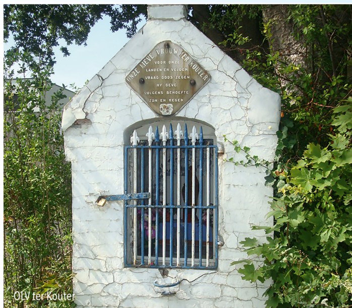
O.L.V. ter Kouter

Op de derde dag vertrokken de Kruisdagen vanaf de kerk richting de Fosselkouter. Dit voormalig ommegangkapelletje heeft ook al een verhuizing meegemaakt. Het was aanvankelijk toegewijd aan de Heilige Barbara. Het mooie beeldje kreeg een plaats in de pastorie en werd, bij de heropbouw van de kapel, vervangen door een Mariabeeldje.