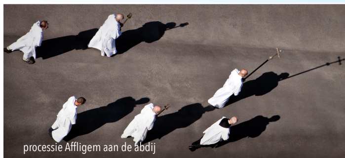
processie Affligem aan de abdij

Rond en naar de kapellen was er dikwijls een ommegang of een processie . De Kruisdagen, afgeschaft in 1966, was een processie in de velden om een geslaagde oogst af te smeken. Deze had plaats drie dagen voor O.L.H.-Hemelvaart. Aangezien het een soort boeteprocessie was gingen de misdienaars met het Kruis voorop. De pastoor, de onderpastoor en een schare gelovigen baden de paternosters, vijf Onze Vaders en vijf maal tien Wees-gegroeten. Tussendoor werd, in het latijn, de litanie van alle heiligen gezongen. Een soortgelijke processie vond plaats in mei op de feestdag van de Heilige Marcus maar met een kleinere ommegang rond de kerk.