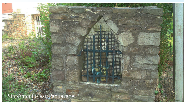
Sint-Antonijs van Paduakapel

Aan huisnummer 45 zien we een nis kapelletje. De vorige eigenaars, familie De Smet-Janssens , gaf in 1960 dit kapelletje een plaats om aan een belofte te voldoen. Achter het smeedijzeren hekje staat een sierlijk beeldje van Sint-Antonius in bruine pij met het kindje Jezus op zijn arm.