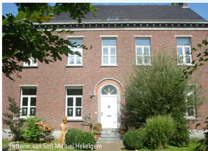
Pastorie van Sint-Michel Hekelgem